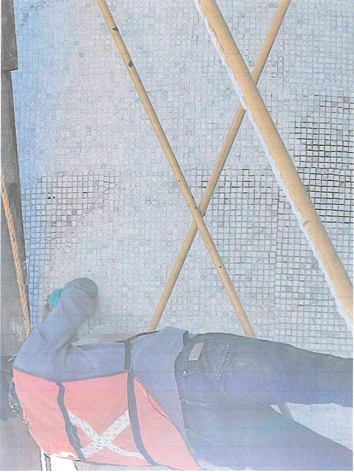
Diferencia entre tesela limpia y sucia durante los trabajos en el sector A5.