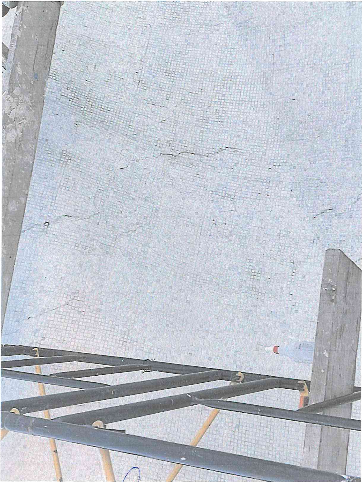
Estado de la tesela blanca luego de la primera fase de limpieza.