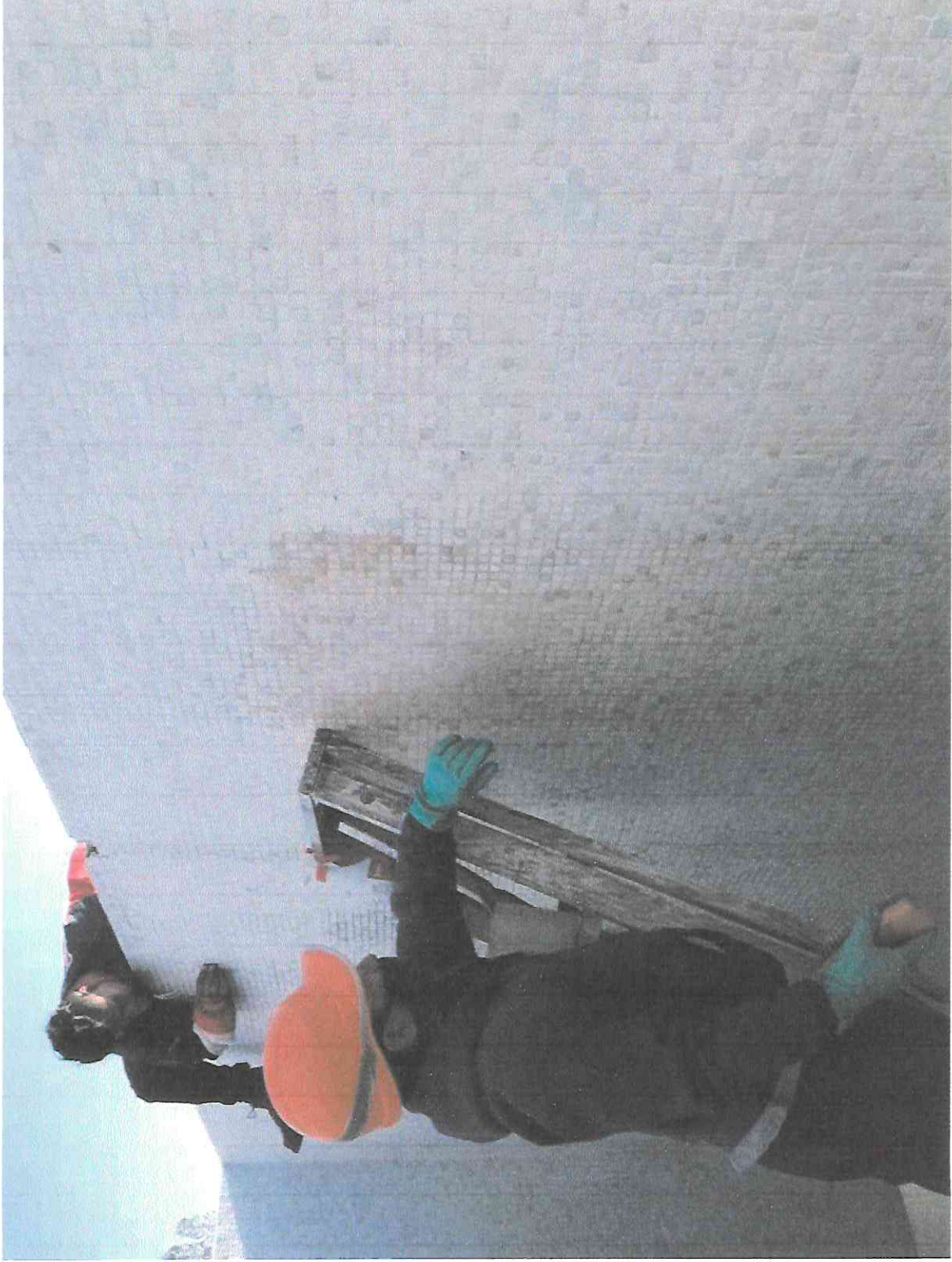
— Limpieza de tesela blanca con cepillo y anti sarro en la fachada del sector A5.